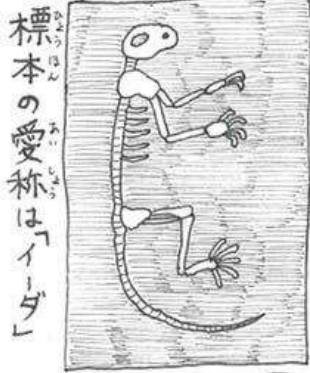
標本の愛称は「イダー」

進化の歴史の空白部分を「ミッシングリンク」と呼ぶのですが、ダルさんはなんと霊長類のミッシングリンクを埋める動物かもしれない...と話題となったのです!! (ででん!!)